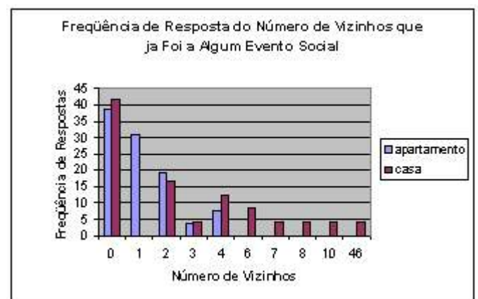
Figura 3: Evento Social

Perguntado se o respondente já foi a algum evento social com seu vizinho, 38,5% dos que moram em apartamento e 41,7% dos que moram em casa responderam que nunca foram a um evento social com seu vizinho. Na Figura 3 vemos que os sujeitos que moram em casa já foram a algum evento social com um maior número de vizinhos enquanto que para os que moram em apartamento a resposta mais frequente foi com apenas um vizinho. Foi perguntado também a frequência com que isso ocorre. Verificou-se que para os que moram em casa e