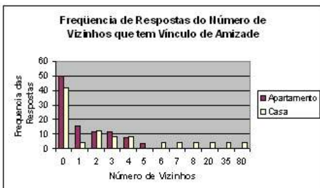
Figura 1: Amizade

Perguntado se o respondente já foi convidado a algum almoço, jantar, festa ou churrasco na casa de algum vizinho, entre os que moram em apartamento 46,15% responderam que nunca foram convidados, enquanto que dos que moram em casa apenas 29,16% responderam que nunca foram convidados para alguma festa, almoço, jantar