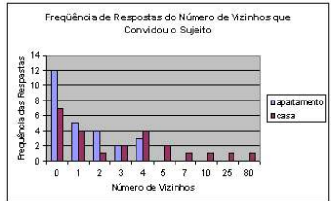
Figura 2: Convites

ou churrasco (Figura 2). Dos que responderam que já foram convidados e que moram em apartamento as respostas mais frequentes do número de vizinhos que os convidaram foram 1 e 2 enquanto que para os que moram em casa as respostas mais frequentes foram 1 e 4 vizinhos.